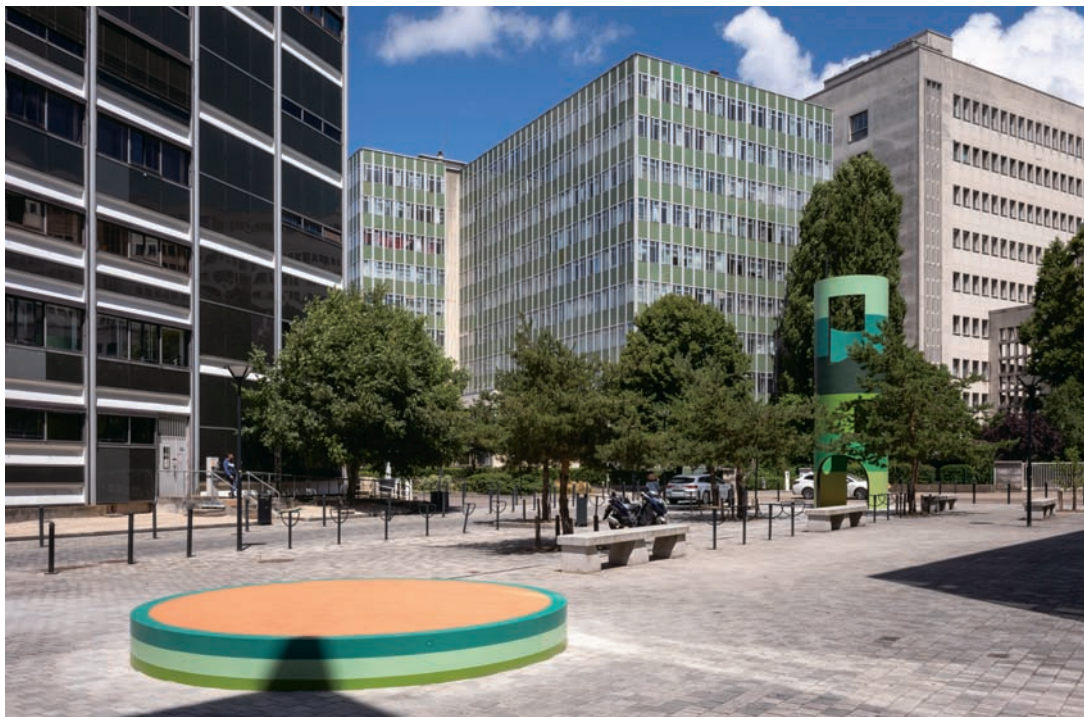
克金·德庫寧 擴建，比亞斯街。南特市 2022 複合媒材裝置 設置於比亞斯街 ©Martin Argyroglo

參與該節慶的當地藝術機構，如：獨特場所當代藝術中心 (Le lieu unique)、布列塔尼公爵城堡 (Château des ducs de Bretagne)、南特美術館 (Musée d'arts de Nantes)、聖十字修道院 (Passage Sainte-Croix) 與HAB當代藝廊 (HAB Galerie) 等，並隨著南特都會發展的擴張計畫漸漸納入新的藝術展覽據點與機構。今年邁入第十一年的南特之旅，即可見到許多新的展覽空間，如：