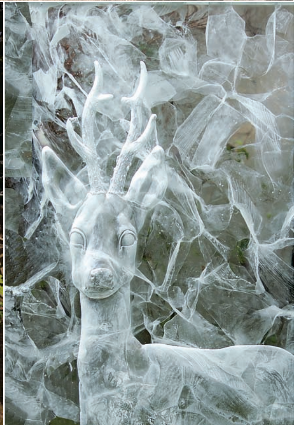
巴斯卡·康維 時代之鏡 2022 玻璃裝置 玻璃技師：奧利維·朱托 設置於慈悲墓園