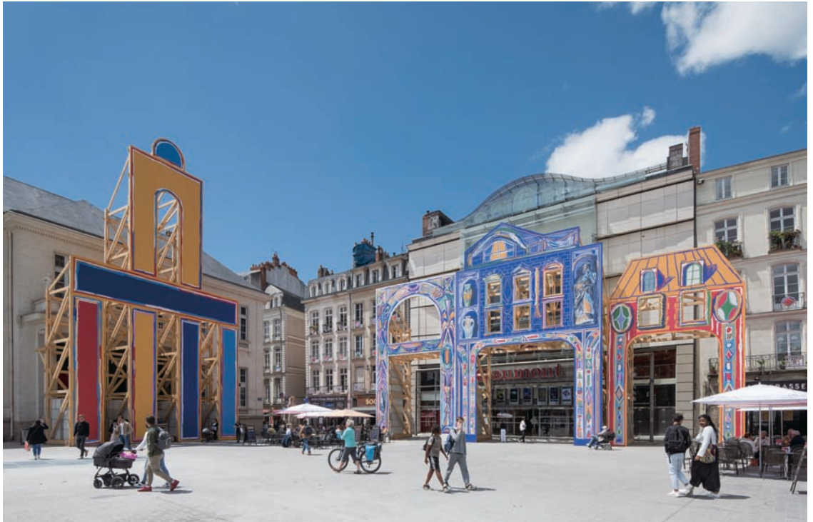
亞力山德·班哲明·納菲 多彩牆面，想像旅程 2022 設置於商業廣場

中三片玻璃浮雕均被金色的線條貫穿，這是藝術家採用日本修復器物的傳統工藝：「金繕」技術來修復在窯燒過程中破裂的玻璃所得到的結果。關於這點，康維指出玻璃窯燒本身就是一個難以完全控制的技術，當玻璃在窯燒過程間破裂之後，他視這種意外屬於藝術創作過程中的一種自然現象，並相信應該將這種結果保存下來，但為了能夠妥善將作品完整地組合起來，他決定採用日本傳統金繕技術來修復這些玻璃碑。呼應墓園中其他的石碑，這些透明的墓碑分別呈現出雄鹿、雌鹿與幼鹿等已經在都會中消失的野生動物，這些半透明的生物沉默、低調地佇立在荒草之間，靜靜地看著來此紀念過世親友的人們身影。「它們凝視的眼光中散發著一種慈悲，修復我們這些繼續活下去的人過去的意外、脆