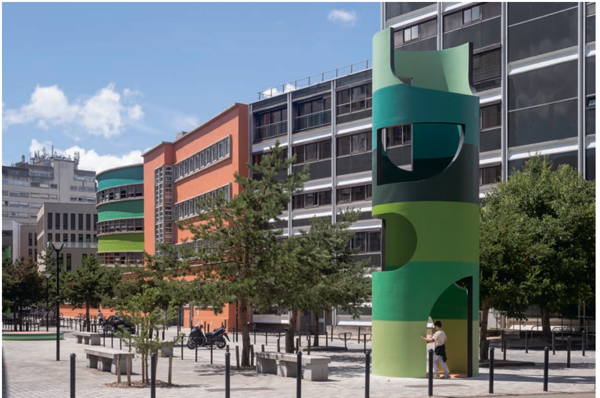
上與下·克金·德庫寧 擴建，比亞斯街。南特市 2022 複合媒材裝置 設置於比亞斯街 ©Martin Argyroglo

羅瓦河大區當代藝術典藏中心（FRAC de Pays de la Loire）第二展場，或集中在南特島（Île de Nantes）上的新學區學校，其中包括南特國立高等建築學院（École nationale supérieure d'architecture）、南特一聖